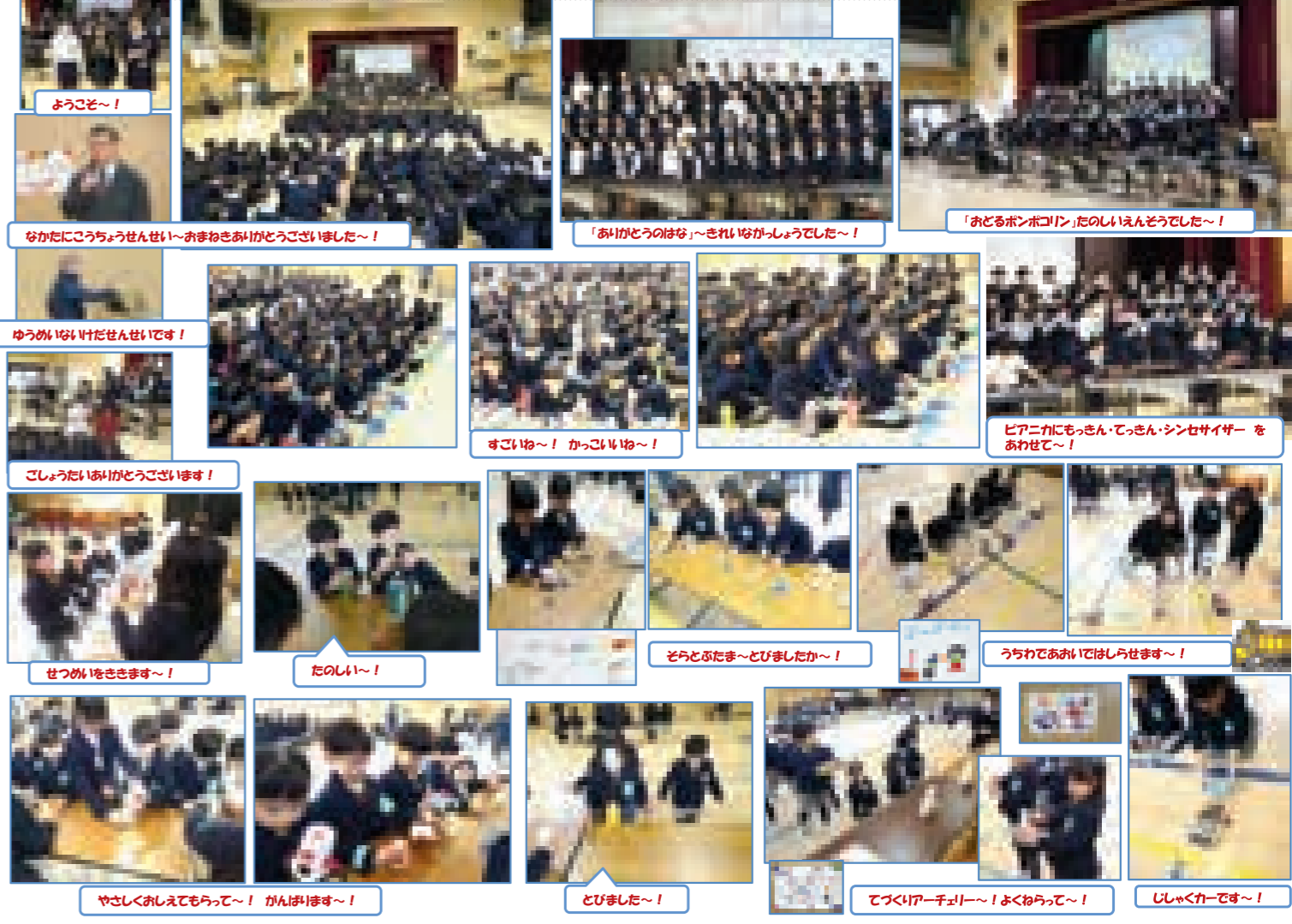
ようこそ~! なかたにこうしょうせいせい~おまねきありがとうございました~! 「ありがとうはな」~きれいな音がうたがうでた~! 「おどるボンボリン」たのしいえんどうでした~! ゆうめいばいけせんせいです! すごいわ~! かっこいいわ~! ごしょうだいありがとうございます! せつめいをききます~! たのしい~! そらとぶたま~とびましたか~! うちであみではしらせます~! やさしくおしえてもらって~! がんばります~! とびました~! てづくりアークチャー~! よくわらって~! じしゃくカーです~!

小学校に入学する年長さんを、片江小学校の2年生があたたかく迎えてくれました。片江小学校の2年生が工夫して考えてくれた《おもちゃランド》のたくさんのゲームコーナーに、年長さんを招待してくれました。どのコーナーも工夫がしてあり、とてもたのしいものでした。あっという間に時間がたってしまいました。“ふれあいタイム”が始まる前に、サプライズの招待がありました。なんと5年生が、たのしい歌やパフォーマンス、そして全員でかっこいい合奏を聞かせてくれました。歌はうつくしい声で~合奏はカッコよく~どの曲もすばらしい演奏で感動しました。音楽の大好きな年長さんも小学校に入学したら、こんなかっこいい小学生になってくれるのかな~と思いながら演奏を聴かせてもらっていました。