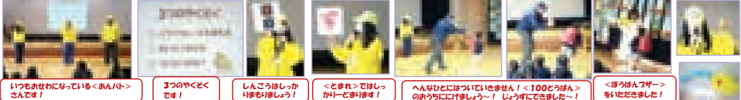
いつもお世話になっている「あんバト」さんです! 3つのやくそくです! しんごうはしっかりしましょう! <どまれ>ではしゃがりどまります! へんごひどにはついていきません! <100とうばん>のおうちにけしめよう~! じょうずにできました~! <ぼうはん7せー>をいただきました!

年長さんは、もうすぐ小学1年生です。聖美幼稚園の年長さんはそれぞれの校区または私学の小学校へ進学しますが、今日は、みんなで安全に楽しく小学校に通えるように、いつもお世話になっている「あんバトさん」から、①交通ルール②あいさつのしかた③危険から身を守る~方法を教えてもらいました。☆交通ルールを守って~☆元気よくあいさつをして~☆おともだちをたくさんつって~☆たのしく~小学校に通ってくださいね。 2月3日(月)