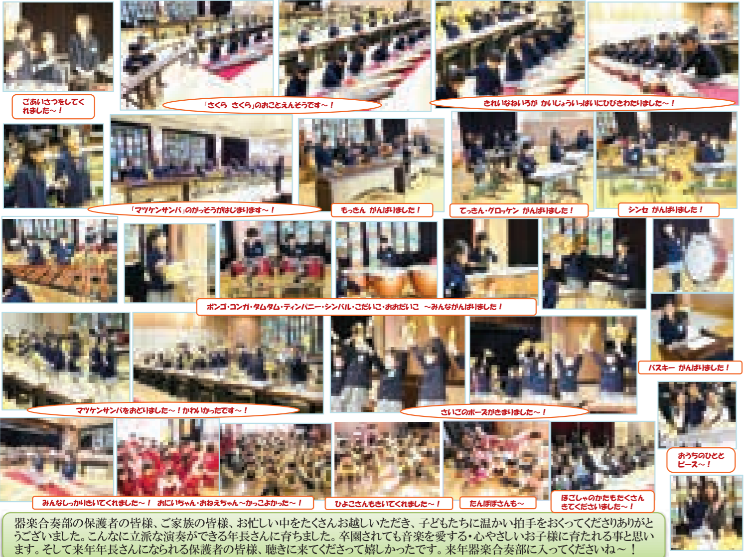
ごあいさつをしてくださいました~! 「さくら さくら」のおことえんどうです~! きれいな音が かじょういばいにひびきわたりました~! 「マツケンサンバ」のかっそうがはじまります~! もっせん がんばりました! てっせん・グロックン がんばりました! シンセ がんばりました! ボンゴ・コンガ・タム・ティンパニー・シンバル・こだいこ・おだいこ ~みんながんばりました! マツケンサンバをおどりました~! かっこよかったです~! さいこのホースがききました~! おうちのひととピース~! みんなしっかきしてくれました~! おにいちゃん・おねえちゃん~かっこよかったです~! ひよこさんもきいてくれました~! たんぼほさんも~ ほごしゃのかたもたくさんきてくださいました~!

器楽合奏部さんは、年長さんの合奏大好きな子どもたちの課外教室さんです。昨年度までは、年長さん全員が参加して、大阪府下の他の幼稚園さんとの合同音楽コンサートに参加していましたが、今年から器楽合奏部さんのみの《園内発表会》となりました。器楽合奏部の子どもたちは、1年間かけて頑張ってきた成果を、お家の方や園児たちにも披露してくれました。お琴演奏は『さくら さくら』~かけあいやトレモロも入れたすてきな演奏でした。合奏は『マツケンサンバ』でした。リズムに乗ってみんなそろってかっこよく演奏してくれました。園内発表会では、年長さんの演奏にみんなきき入っていました!「かっこよかったです!」という感想をたくさんもらって、器楽合奏部さんもうれしそうでした! アンコールで『マツケンサンバ』をみんなで踊ってくれました。鑑賞してくれたたんぼほ・ひよこ・年少・年中・年長さんたちは大喜びでした! 指導に携わってくれた器楽合奏部の先生達ありがとうございました。1月31日(金) 2月1日(土)