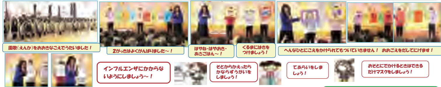
国歌(えんか)をおおきなこえでうたいました！ 2がっきはよくがんばりました～！ はやね・はやおき・あさこはん～！ くるまにはきをつけましよう！ へんなひとにこえをかけられてもついでいけません！ おおこえをだしてにげます！ インフルエンザにかからないようにしましよう～！ ぞとからかえたらかならずうがいをしましよう！ てあらいをしましよう！ おととにでかけるときはできるだけマスクをしましよう！

「2がっき、とてもよくがんばりました！ ふゆやすみには、じこにあわないようにして、よいおしよがつをむかえてください！ うがいやてあらい、マスクをしっかりと、インフルエンザなどにかからないようにしましょう！ 3がっきの1月10日(金)のしぎょうしきには、みんなげんきにとうえんしてきてくださいね！」とごあいさつしました。にこにこ顔の子どもたちでした！