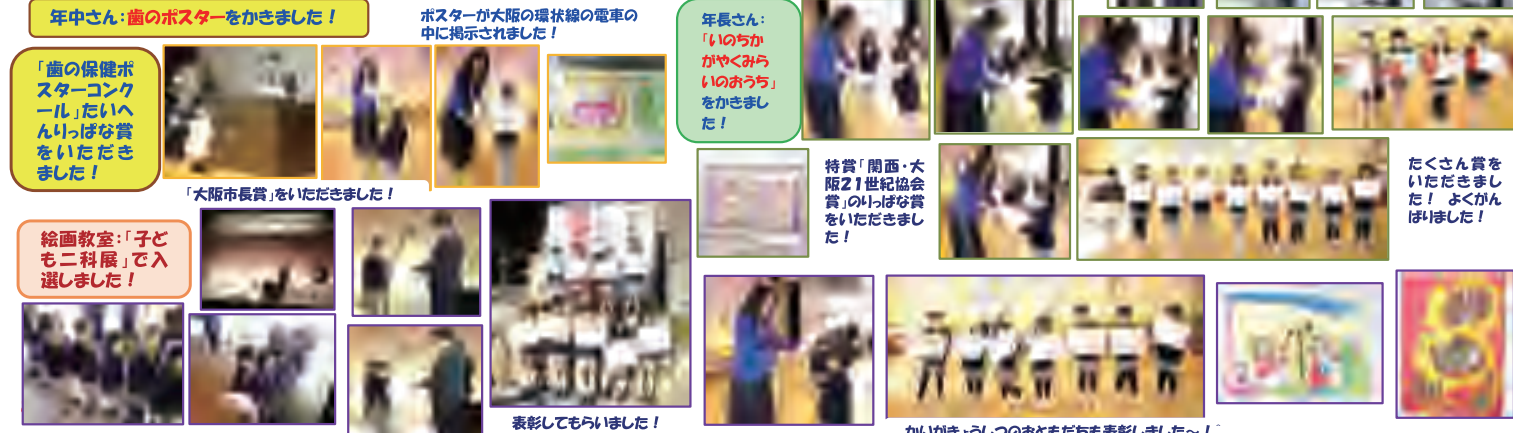
年中さん：歯のポスターをかきました！ ポスターが大阪の環状線の電車の中に掲示されました！ 年長さん：「いのちががやくみらいのおうち」をかきました！ 待賞「関西・大阪21世紀協会賞」のいっば賞をいただきました！ 「歯の保健ポスターコンクール」たいへんいっば賞をいただきました！ 「大阪市長賞」をいただきました！ 絵画教室：「子ども科展」で入選しました！ 表彰してもらいました！ かいがきょうしつのおともだちも表彰しました～！ たくさん賞をいただきました！ よくがんばりました！