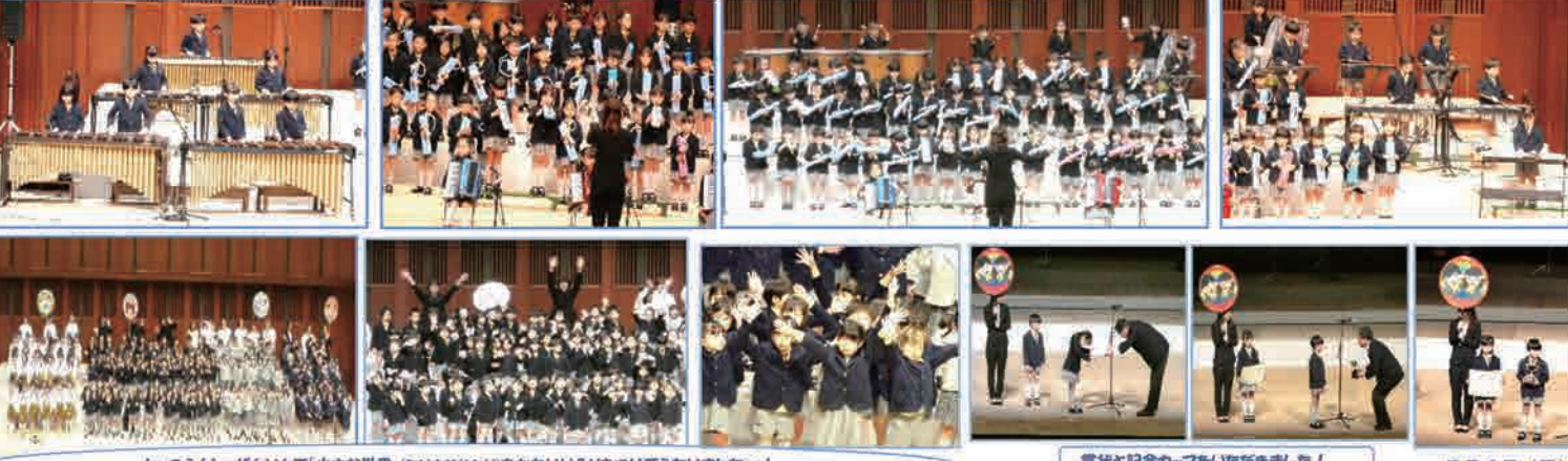
お琴演奏(おこえんどう)！「荒城の月」(こうじょうのつき)をえんどうしました！ しつじとしたおんがくが会場中にひびきわたりました～！ 合奏曲：「新世界」(しんせかい)をぜんいんでえんどうしました！ すばらしいえんどうでした～！ しつえんしぜんいんで「小さな世界」(ちいさなせかい)をかわいらしいおんがくをつけてうたいました～！ 賞状と記念カップをいただきました！ 2月4日(日) 2月2日(金) おんちょうさん がんばりました～！