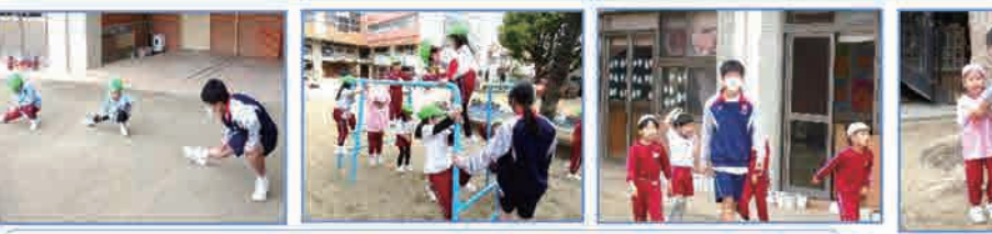
ぞつえんせいがたくさんきてくれました～！ こどもたちたくさんかかわってくれました～！ こどもたちもおおよろこびでした～！ おつかいさまでした！ またあそびにきてください～！