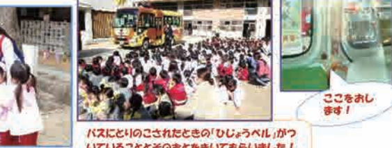
バスにのりこされたときの「ひじょうベル」がついていることとおどおどを覚えてもらいました！ バスのなかでもおしえてもらいます！ 先生たちにはしゃがみほえてもらいました！